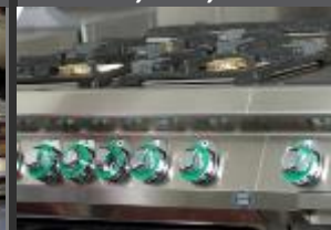
LINKY 600, 700, 900