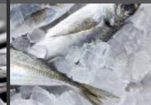
CHLAZENÍ A VÝROBA LEDU