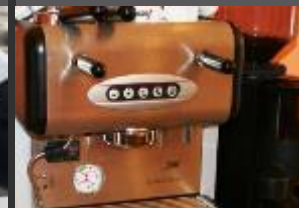
KÁVOVARY A BAROVÁ ZAŘÍZENÍ