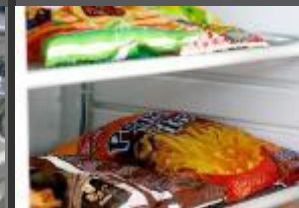
CHLAZENÍ A VÝROBA LEDU