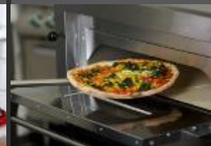
ZAŘÍZENÍ PRO PIZZERIE