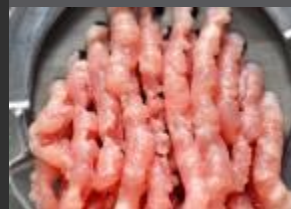
ROBOTY, PŘÍPRAVA MASA+ZELENIINY