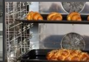
KONVEKTOMATY A ŠOKERY