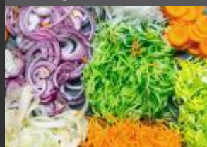
ROBOTY, PŘÍPRAVA MASA+ZELENIINY