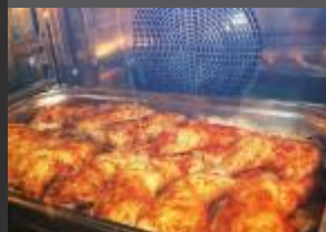
KONVEKTOMATY A ŠOKERY