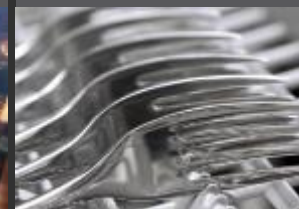
MYČKY A MYTÍ NÁDOBÍ