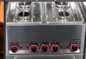
LINKY 600, 700, 900