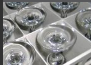
MYČKY A MYTÍ NÁDOBÍ