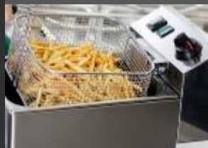
MALÁ STOLNÍ ZAŘÍZENÍ