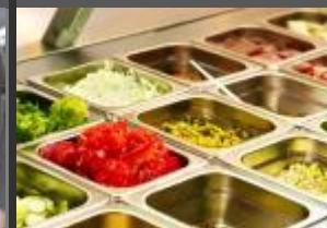
VITRÍNY, V. LÁZNĚ, PŘÍSLUŠENSTVÍ