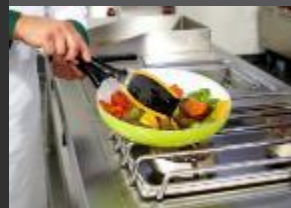
VARNÁ CENTRA DROP IN